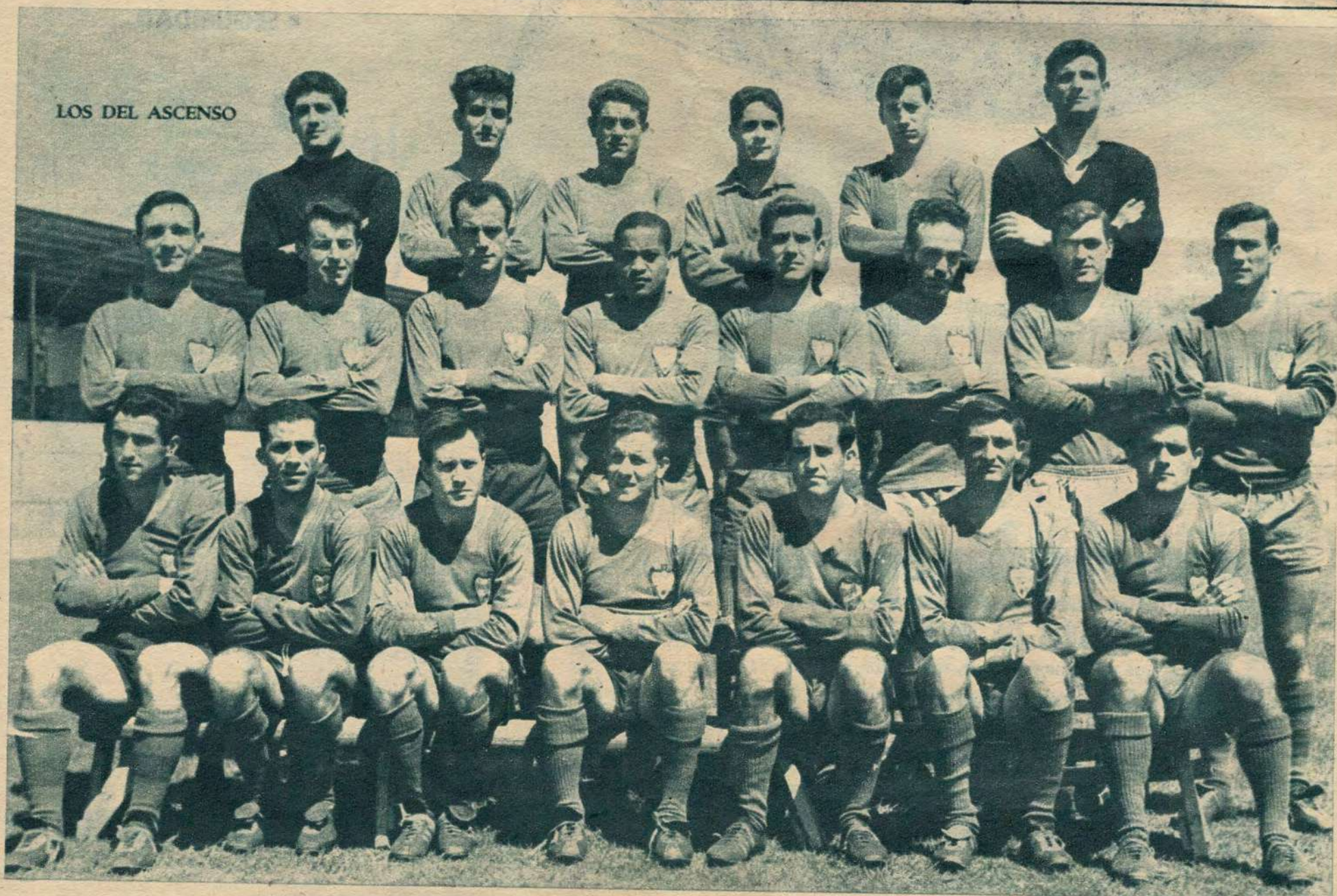
He aquí a los 21 jugadores que forjaron el ascenso del Levante U. D. a Primera División