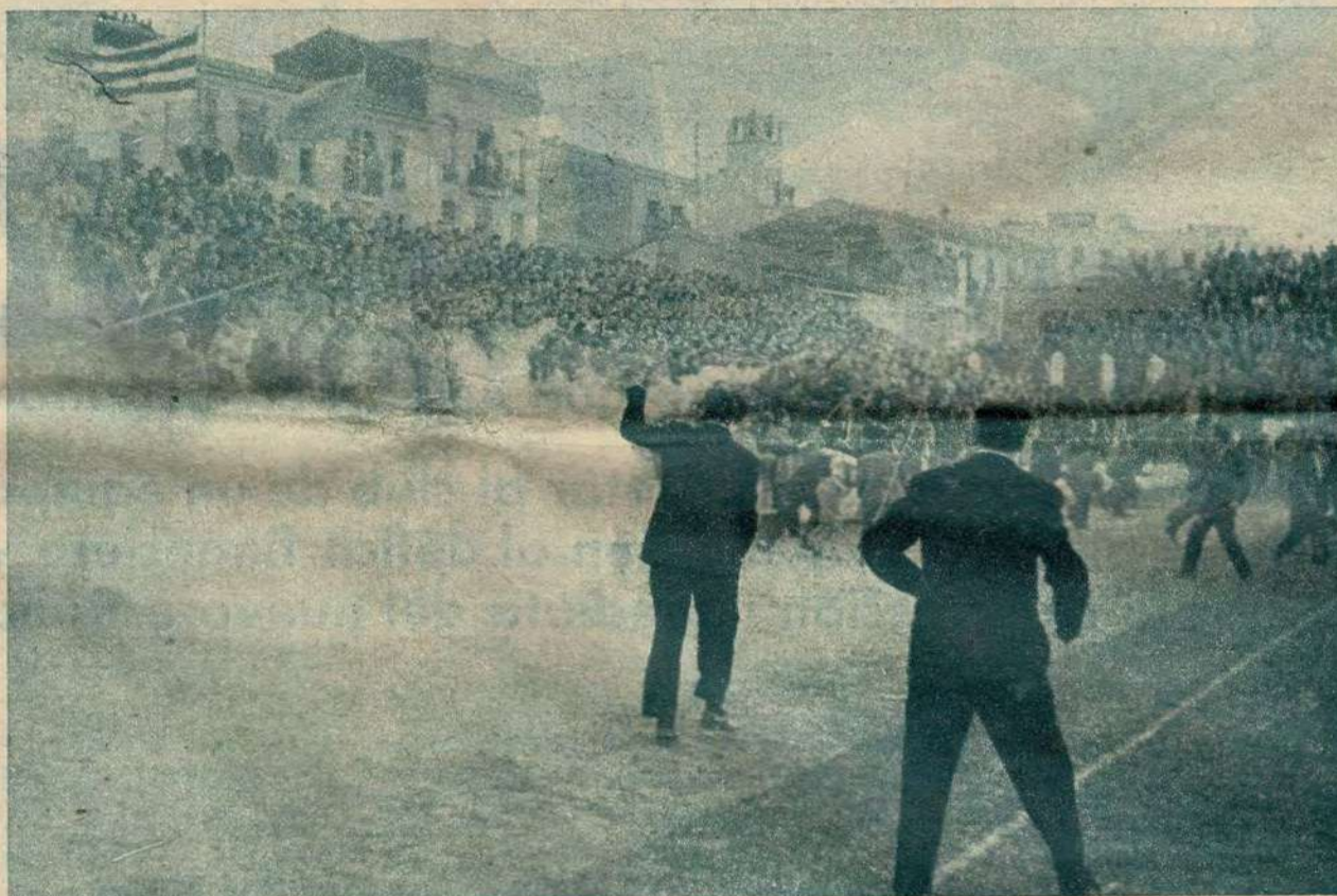
EL LEVANTE CAMPEON. —La temporada 1955-56 ascendió el Levante a Segunda División, por campeón de Tercera. En Vallejo, entonces, desatóse una alegría incontenible. El público invadió multitudinariamente el terreno de juego. Los estampidos de las carcasas y de las tracas ambientaron el entusiasmo popular. Los jugadores fueron izados a hombros de los aficionados. Eso mismo se ha reproducido con creces el pasado domingo, siete años después, culminando las esperanzas del club azulgrana y de la Valencia deportiva