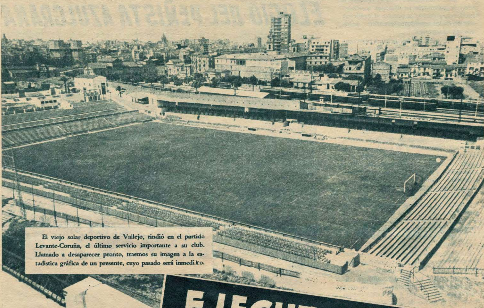
El viejo solar deportivo de Vallejo, rindió en el partido Levante-Coruña, el último servicio importante a su club. Llamado a desaparecer pronto, traemos su imagen a la estadística gráfica de un presente, cuyo pasado será inmediato.