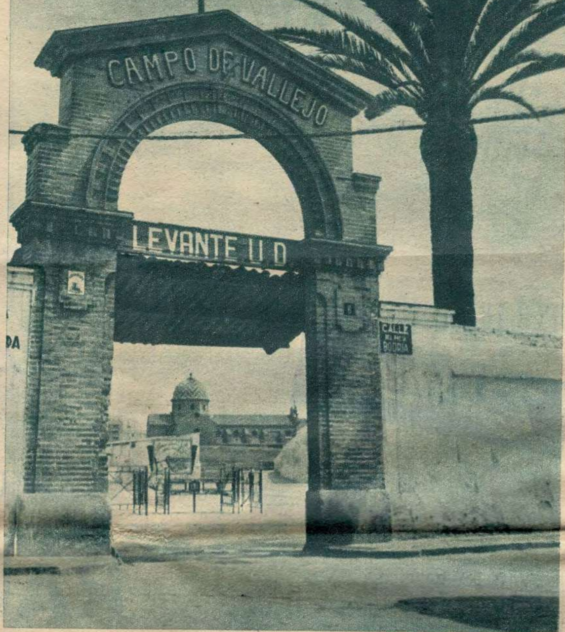
La puerta de la ilusión, el muro de las lamentaciones, la palmera de la esperanza, constituyen el simbolismo de una historia deportiva, la del Levante, que el pasado domingo quedó cerrada con un triunfo rotundo y definitivo

Es la hora del estallido de la alegría, de la privanza del entusiasmo, del ondear victorioso de las banderas azulgranas, del aplauso, de la felicitación y del entusiasmo. Todo está muy en su punto, hasta lo que de hiperbólica expresión pudo darse. Veintidós años de contrariedades y de desilusiones, de sacrificios baldíos en apariencia, a veces incluso de humillación, bien valen la fiesta mayor de hoy. Ahora bien, repetimos, que el Levante ha cerrado el libro cronológico de su larga etapa como club menor y abre el nuevo como club grande. Eso obliga a mucho. Pasado el momento triunfal, acallados los ecos de la victoria, hay que seguir para merecer por siempre lo que tanto costó ganar. A directiva de Primera División, a equipo de Segunda ingresado en la Primera, a campo de Tercera, corresponde un club con personalidad mayor, un equipo mejor y un campo digno de Valencia. Nada faltará, nos consta.